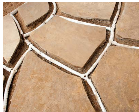
Пример установки Eco-Wrap