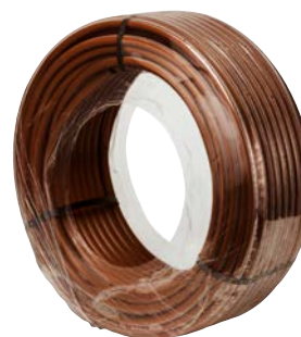
Κουλούρα με ελαστική μεμβράνη