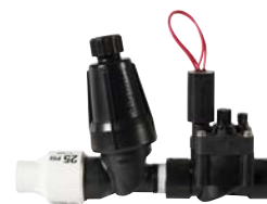
PCZ csepegtető öntöző indító szett