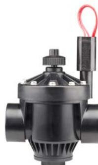
PGV-151 Csatlakozó méret: 40 mm