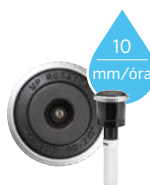
Normál MP Rotator 2,5-10,7 m