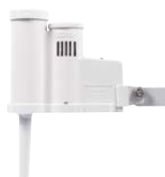
Vezeték nélküli Rain-Cliik™