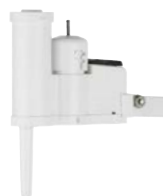
Vezeték nélküli Mini-Cliik™