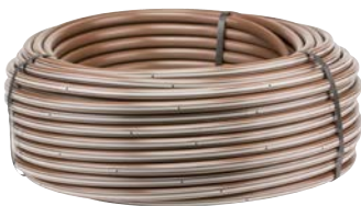
Hunter csepegtetőcső (HDL)

A Hunter csepegtetőcsőhöz hasonló mikroöntöző termékek a maximális vízmegtakarítás elérése érdekében lassan és pontosan osztatják el a vizet a növény tövében.