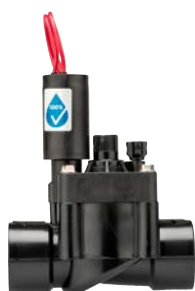
PGV-101G Csatlakozó méret: 25 mm