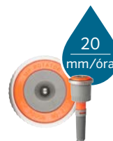
MP Rotator MP800 1,8-4,9 m