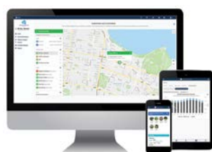
Asztali számítógépes és mobil szoftverek