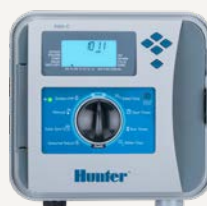
Szabványos váltóáram (AC)