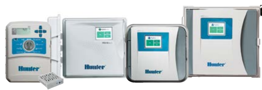
X2 Pro-HC HPC HCC WAND-dal