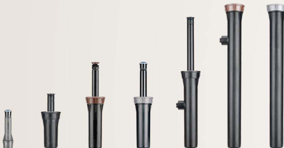
Illustrazione: irrigatore PRS40 fuori terra, Pro-Spray da 5 cm, PRS30 e PRS40 da 10 cm, Pro-Spray da 15 cm e PRS30 e PRS40 da 30 cm

Tutti i modelli sono dotati di un tappo di spurgo con anello per alzare la torretta e ridurre al minimo detriti e occlusioni. Inoltre, gli irrigatori Pro-Spray sono compatibili con tutti gli ugelli femmina standard del settore, consentendo la massima flessibilità.