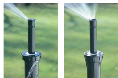
Soluzione della concorrenza

Il calpestio, i macchinari per la manutenzione del verde, i cambi di temperatura e le variazioni di pressione possono causare l'allentamento del coperchio dell'irrigatore. La maggior parte degli irrigatori statici utilizza una guarnizione O-ring, che perde la tenuta immediatamente dopo l'allentamento del coperchio. Il coperchio del Pro-Spray può resistere a un giro completo a 360° e resta sigillato con qualsiasi pressione.