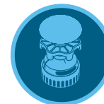
Vezeték nélküli kapcsolat a szeleppel