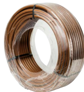
Rotoli di piccole dimensioni