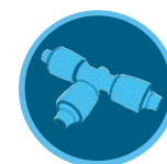
Raccordi PLD Pagina 165