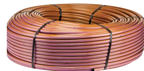
HDL-R (для технической воды)

Дополнительное цветное обозначение источников подачи технической воды, используется только для изделий размером 17 мм.