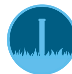
Eco-Indicator Страница 181