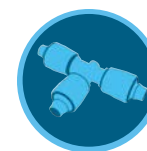
Фитинги PLD Страница 177