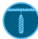
Soil-Clik Страница 157