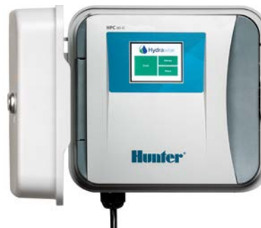
HPC (műanyag beltéri/kültéri) 22,9 cm magas 25,4 cm széles 11,4 cm mély