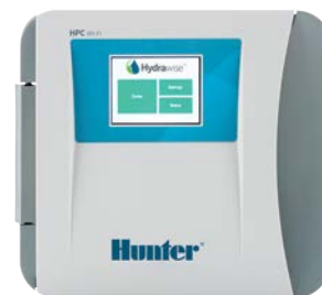
Hpc Cserélhető Előlap