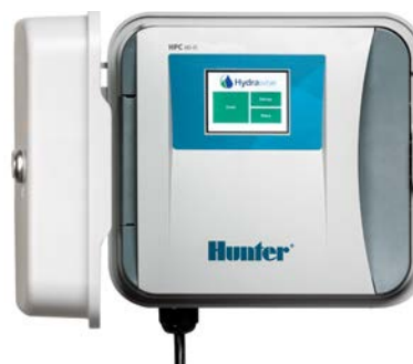
HPC (per interni/esterni, in plastica) Altezza: 22,9 cm Larghezza: 25,4 cm Profondità: 11,4 cm