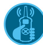
Telecomando ROAM Telecomando ROAM XL