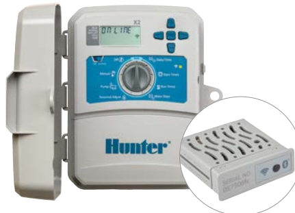
Controlador X2 con módulo WAND 4, 6, 8 y 14 estaciones