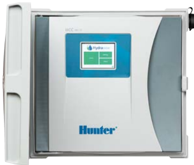
Programador HCC De 8 a 54 estaciones, con opción de EZDS de dos hilos