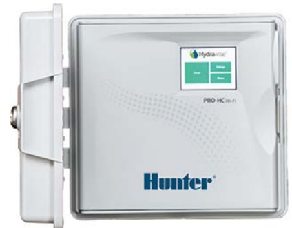
Programador Pro-HC 6, 12 y 24 estaciones