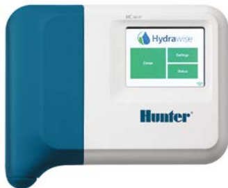
Programador HC 6 y 12 estaciones

Reconocida como una herramienta responsable ahorradora de agua.