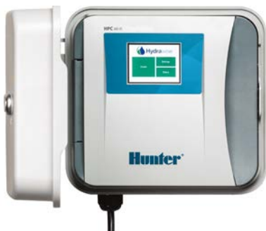
Programador HPC De 4 a 32 estaciones, con opción de EZDS de dos hilos