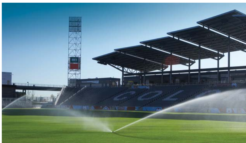
Model I-40 s obojstrannými tryskami 360°

Dostupný na inštaláciu priamo v teréne pri všetkých modeloch Obj. č. TURFCUPKITI40