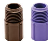
IH-FIT-3850, IH-FIT-3850-R Conector MPT IH (água residual) de 3/8" x 1/2"