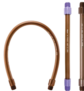
TUBOS DE SUBIDA IH (PVC FLEXÍVEL)