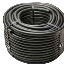
IPS-050-250 PVC flexível para criação de cabeças ou tubo de subida personalizados