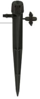
SD-B-STK Yükseklik: 15,2 cm