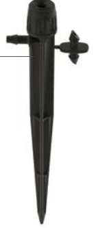
HS-B-STK Yükseklik: 15,2 cm