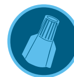
Conectores de cables