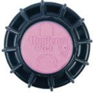
PGJ Arıtılmış Su Ayırt Etme Kapağı

Tüm modellerde fabrikada montajlı bir opsiyon olarak bulunur