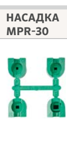
PGP-04 Ultra с насадкой MPR-30