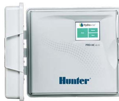
Pro-HC (plastový vnútorný model) Výška: 21 cm Šírka: 24 cm Hĺbka: 8,8 cm

Vyskúšajte ešte dnes softvér Hydrowise bez hardvéru na stránke hydrowise.com