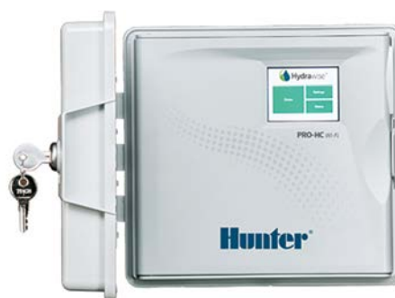
Pro-HC (plastový vonkajší model) Výška: 22,8 cm Šírka: 25 cm Hĺbka: 10 cm