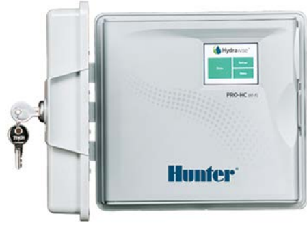
Pro-HC (plastik dış mekan) Yükseklik: 22,8 cm Genişlik: 25 cm Derinlik: 10 cm