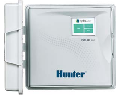
Pro-HC (plastik iç mekan) Yükseklik: 21 cm Genişlik: 24 cm Derinlik: 8,8 cm

Hydrawise Yazılımını bugün deneyin, hydrawise.com sitesinde ücretsizdir.