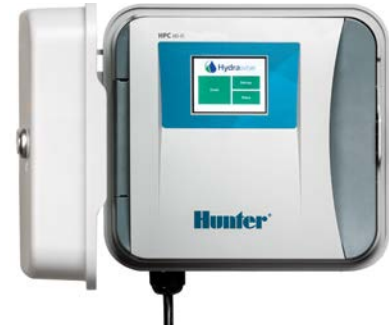
HPC (塑料室内型/室外型) 高: 22.9 cm 宽: 25.4 cm 厚: 11.4 cm