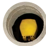
① Acoplador rápido

Todas las arquetas ST incluyen prácticas aberturas de acceso rápido. Los acopladores rápidos proporcionan una conveniente toma de agua para limpiar vertidos o pintura soluble en agua. El diseño integrado del interior elimina la necesidad de arquetas adicionales para bocas de riego.