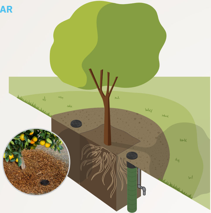
Sistema de riego en zona radicular

El RZWS se puede apagar o modificar con difusores emergentes para aportar el riego adecuado para los árboles en maduración.