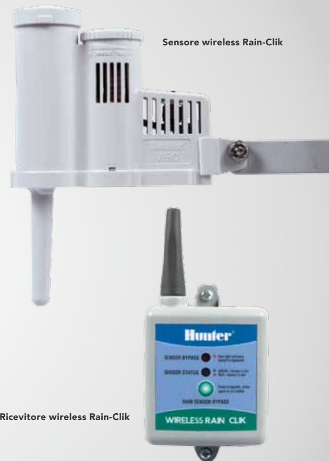
Sensore wireless Rain-Clik

Nota: Rain-Clik wireless non è disponibile in alcune aree a causa delle normative locali sull'approvazione della banda a 433 MHz