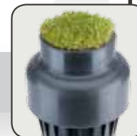
Kit Cestello portazolla (codice 467955)