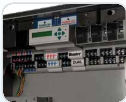
Modulo DUAL48M installato

È il modulo stesso a rendere "Dual" questo programmatore. È sufficiente installare il modulo DUAL48M in qualsiasi I-Core per predisporlo al funzionamento monocavo. Grazie a una capacità massima di 48 stazioni, I-Core Dual può essere adattato a progetti di qualsiasi dimensioni. Inoltre, grazie alla flessibilità offerta dalla tecnologia a due cavi, è semplicissimo espandere il numero di stazioni di un sistema preesistente senza ulteriori interventi al cablaggio.