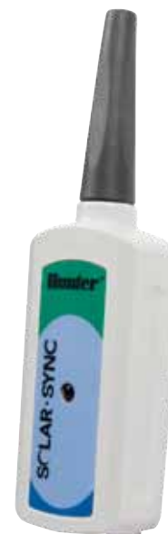
Ricevitore Solar Sync