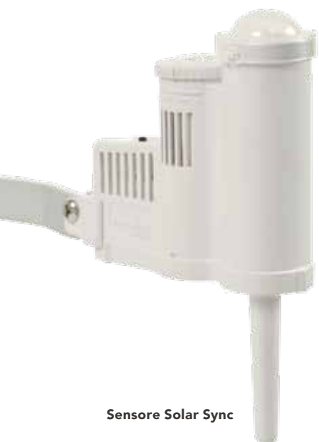
Sensore Solar Sync

Grazie all'uso di un sistema di irrigazione che reagisce automaticamente in base al cambiamento delle condizioni atmosferiche e delle temperature, si ha la garanzia di irrigare i paesaggi con la quantità di acqua di cui necessitano: non una goccia di più o di meno. >>