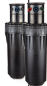
I-90: Altezza complessiva: ADV/36V: 28 cm Diametro esposto: 9 cm Filetto ingresso: BSP femmina da 1½ di pollice (29,21 cm)

Le informazioni complete sui prodotti sono disponibili nel catalogo Hunter Industries 2011, scaricabile dal sito www.hunterindustries.com . >>