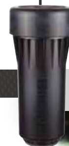
Kit coperchi in gomma (codice 234200, codice 234201)